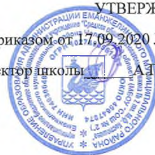
График работы комиссии по контролю за организацией питания на II полугодие 2020-2021 уч. года