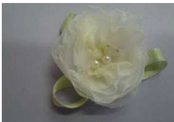
Результат практической работы.